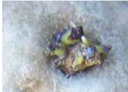
De indigo-kleurige kiem van het Wâldgieltsje

Ze worden zelfs de blauwe mensen genoemd, omdat hun huid op de duur min of meer met deze kleurstof raakt geïmpregneerd.